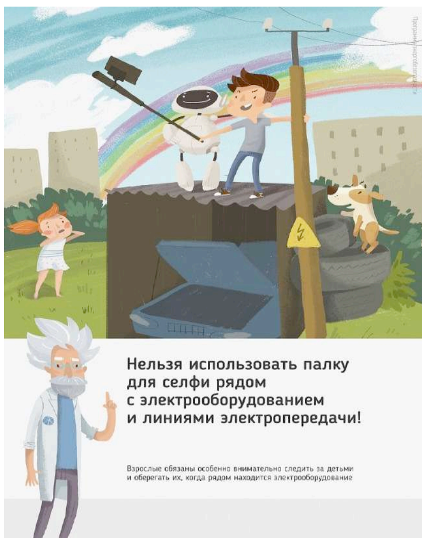
Рис 2. Нельзя использовать палку для селфи рядом с электрооборудованием и линиями электропередачи

Ну и, наконец, нужно повторить с ребенком алгоритм действий в экстремальной ситуации. Проверьте, умеет ли он набирать на сотовом телефоне телефон экстренных служб. Изучите с ним вещества и предметы, которые хорошо проводят электрический ток и потому особенно опасны, и, наоборот, вещества и предметы, плохо проводящие электрический ток и полезные в экстремальной ситуации.