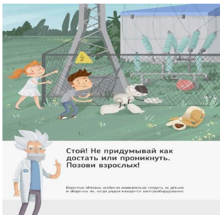
Рис. 5 Стой! Не придумывай как достать или проникнуть. Позови взрослых!