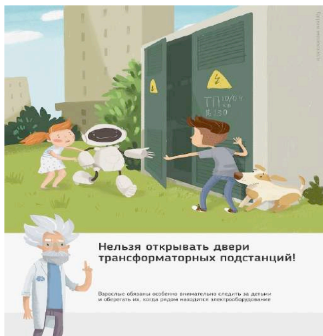
Рис.1 Нельзя открывать двери трансформаторных подстанций

Ежегодно энергетики проводят для школьников познавательные уроки, конкурсы рисунков и историй на тему электричества и правильного с ним обращения. Но работы одних энергетиков в данном направлении недостаточно, для полного понимания проблем электробезопасности нужен пример общества, в котором растет ребенок, и, конечно же, главным образом родителей. Эта работа приносит свои результаты: электротравмы на энергетических объектах единичные, и каждый случай становится поводом для служебной проверки. Но только технических мер мало для того, чтобы полностью обезопасить детей. Им нужен пример родителей.